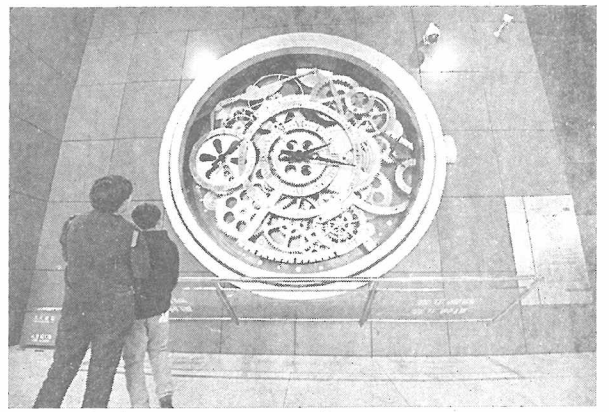
探索科技奥秘 清明假期,众多游人来到北京中国科学技术馆参观游览,探索科技奥秘。图为4月3日,游人在科技馆内参观游览。